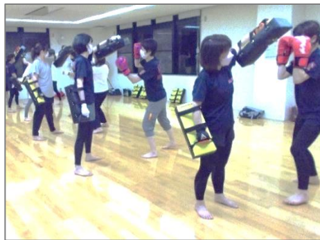
(キックボクシング)