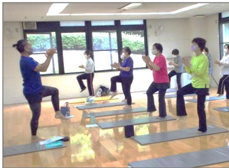
(各施設内で行う講座)

高齢者が住み慣れた地域や家庭で、いつまでも健康で生きがいのある生活を送ることができるよう、生活機能の維持向上に繋がる講座を開催する。