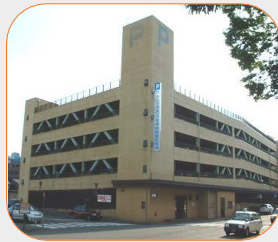
フェニックス・プラザ自動車駐車場