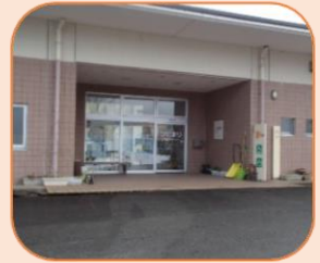
清水高齢者福祉センター