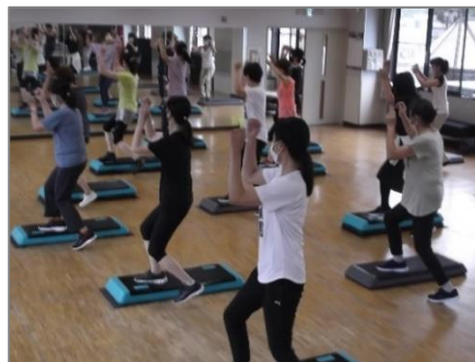
(ステップ台を使った講座)