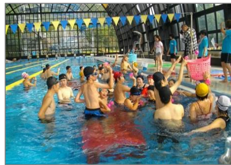
(障がい者の水泳教室)