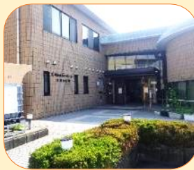
足羽ふれあいセンター