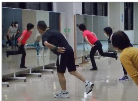
(下半身を鍛える講座)

初心者でも気軽に楽しく参加し、運動のきっかけづくり、運動習慣の定着を図るための健康づくり講座を開催する。