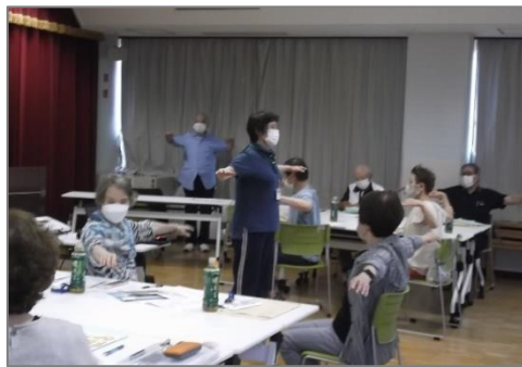
(地区福祉委員への運動講座)

また、クリーンセンターの余熱を利用した50m温水プールを活用し、大学の水泳部や地区体育振興会、県トライアスロン協会等の地域スポーツの推進及び人材育成を支援する。