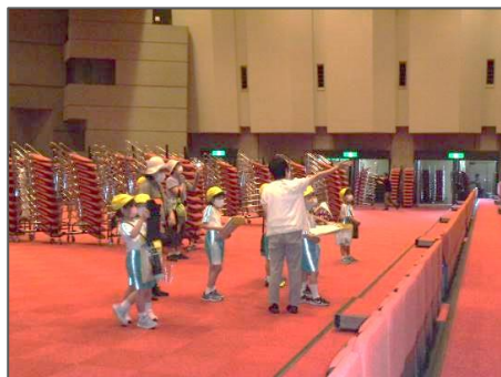
(電動椅子操作見学)