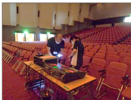
(舞台照明操作体験)