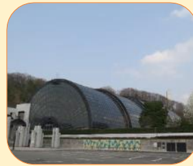
東山健康運動公園