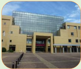
フェニックス・プラザ