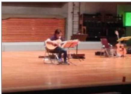
(大ホール舞台体験)

大ホール、小ホールの空き日を利用し、地域に密着した文化活動団体や、福井市内の小・中・高等学校の文化部活動及びグループ活動団体に、ホールの舞台を体験する機会を提供する。