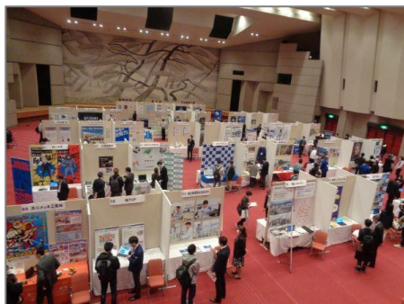
(就職説明会：大ホール)

フェニックス・プラザにおいて、就職説明会や展示販売等の企業活動に伴う利用など、公益目的以外でのホール、会議室の貸館業務を実施する。