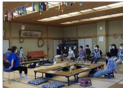
(各地域へ出張して行う講座)