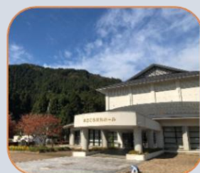
木ごころ文化ホール