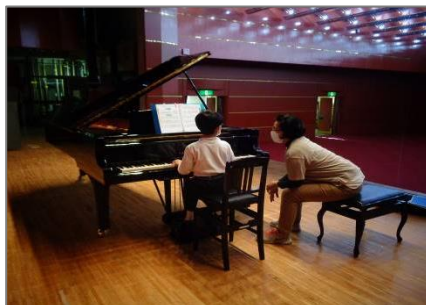
(小ホールでのピアノ演奏体験)