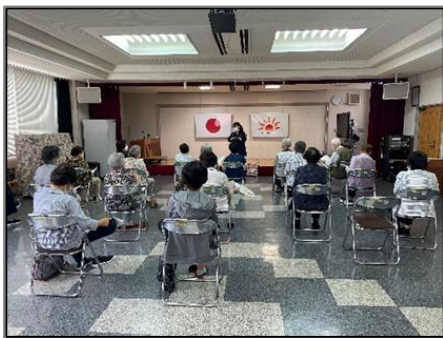
日之出デイホーム