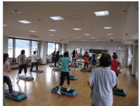
(ステップ体操) 足羽ふれあいセンター