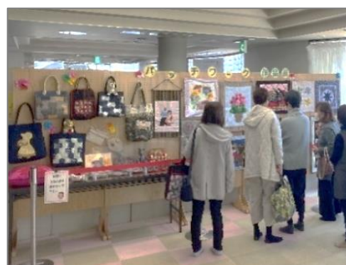
(パッチワーク講座作品展)