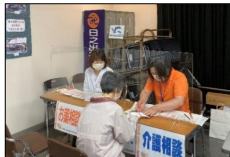
(日之出地区福祉ふれあいまつりで健康相談・介護相談)

日之出地区福祉ふれあいまつりに参加し、健康相談や介護相談を行うとともに、包括支援センター業務の周知やチラシの配布も行った。