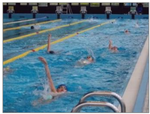
(市水泳連盟加盟団体の練習)