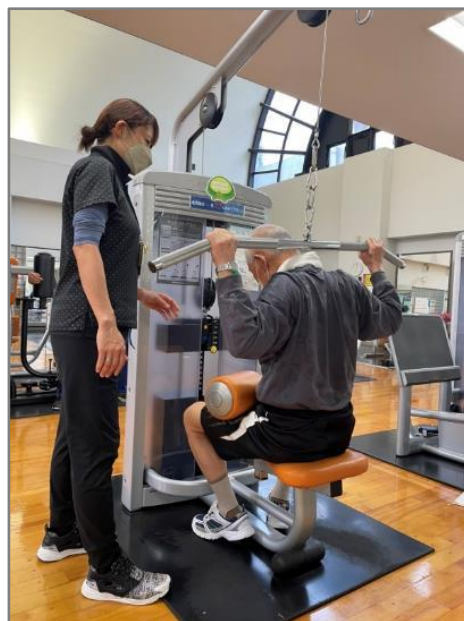
(健康運動指導士による運動指導)