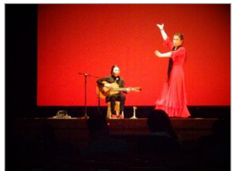
(フェニックス・プラザの舞台に上がろう)