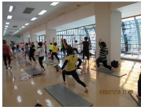
(新春イベント) 東山健康運動公園