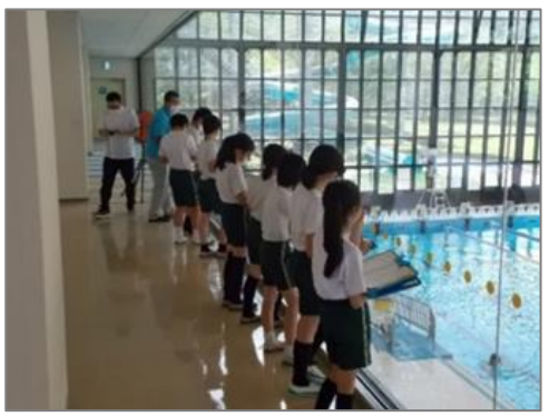
(小学生の社会科見学)

足羽ふれあいセンターでは、足羽婦人会と協働し、健康運動指導士による運動指導を行った。