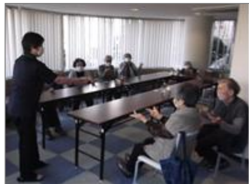
(足羽地区よろず茶屋) 足羽ふれあいセンター