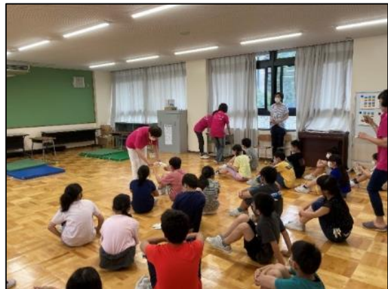
(認知症サポーター養成講座:順化小学校)

認知症の普及啓発活動として、福井銀行新入行員と順化小学校5年生に認知症サポーター養成講座を開催した。