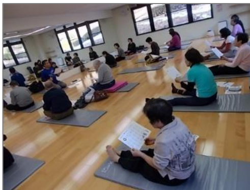
(からだの通信簿アップ講座) 東山健康運動公園