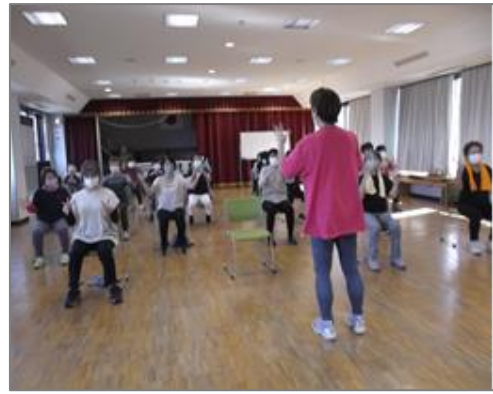
(足羽婦人会と協働した運動指導)