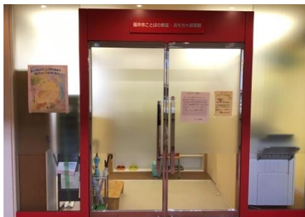
福井市ことばの教室 外観